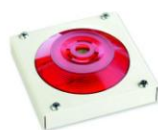
МАЯК-220-КПМ1-НИ оповещатель комбинированный, металлический корпус, наружное исполнение