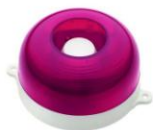
МАЯК-12-КП, МАЯК-24-КП оповещатель комбинированный